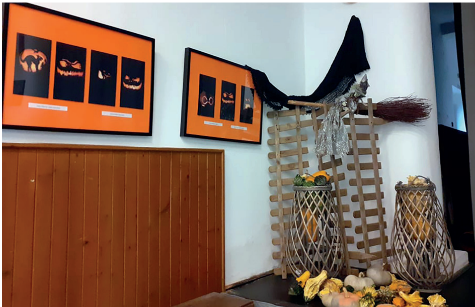
Őszi hangulat a művelődési központban

Egy hiedelem szerint október utolsó napján a legvékonyabb a választóvonal az élők és a holtak világa között. Az elkárhozott lelkek addig barangolnak, amíg meg nem találják egykori lakhelyüket és megpróbálnak visszatérni az élők világába. Már a kelták is védekeztek ez ellen. Október 31-én miután betakarították a termést és elraktározták télre, megkezdődött a mulatság. Szellemnek öltözve parádézta az utcákon, hogy a Gonoszt megzavarják és végleg elűzhessék. Az úgynevezett Jack-lámpa kettős célt szolgált. Egyrészt távol tartotta a gonosz szel-