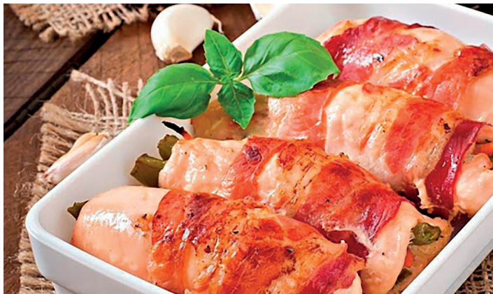
Csirkemell zsályával feltekerve

Főzzünk finom húsleveset, hiszen tudjuk, egy jó húsleves-től még a beteg is meggyógyul. Ugyanígy gyógylevelek a tárkonyos, babérleveles, káposztalével készült levesek is. Közelednek az ünnepek, hamarosan itt van az advent, majd a karácsony, új esztendő. Ezek az ünnepek mások lesznek mint az eddigiek. Valószínű mindenki magában fog ünnepelni, mert féltünk és félünk. De ne hagyjuk el magunkat, ötleteljünk, kísérletezzünk, hiszen a mostani helyzetben más dolgunk nincs. Ne hagyjuk elhatalmasodni magunkon a