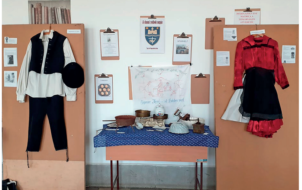
Sváb kiállítás a gimnázium aulájában

Így lehetne összefoglalni az első nemzedékek harcát az új hazában, ahol végül tényleg otthonra leltek. Majd méltatlan