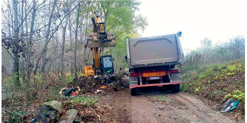
Dolgoztak a munkagépek már a Homokbányában is

A legfontosabb és nehéz szívvel, hosszú egyeztetéseket, vitákat követően megszületett döntés az üdülőingatlanok adóját érinti. A súlyadó elvonása miatt fellépő pénzügyi hiány legalább részbeni pótlására a testület 250 Ft/m 2 összeggel emelte a hétvégi házak után fizetendő adót. A testület döntésénél fontos szempont volt,