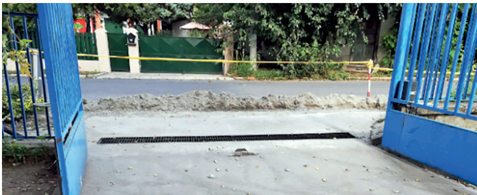
A mentőállomás megújult bejárata

A globális csapadékvíz-elvezetés problémát nyilvánvalóan nem oldja meg egy 10 m hosz-