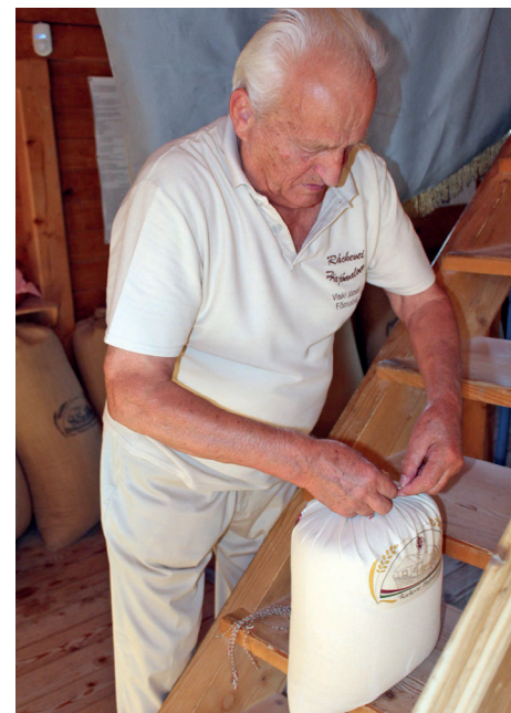
A frissen őrölt lisztet zsákolja a főmolnár

A hétköznapokban általában két munkatárs fogadja a vendégeket. Elmondják a malom működését, de még lisztet is adnak el, ha van rá igény. Idegenvezetőnk is van, aki elmeséli a vízimolnárság és a hajómalom történetét. Látogatók az ország minden részéből jönnek - mutatják a gombostűk a Magyarország-térképen. De kibővítettük európai-, majd világ-térképpel is. Azokon is szaporodnak a jelölések. Vendégkönyvünkben a magyaron kívül angolul, japánul, de még vietnámi nyelven is található bejegyzések. 64 országból érkeztek eddig látogatók. Évente 7-8 000 fizető vendégünk van, vagyis ez a hajómalom – el-