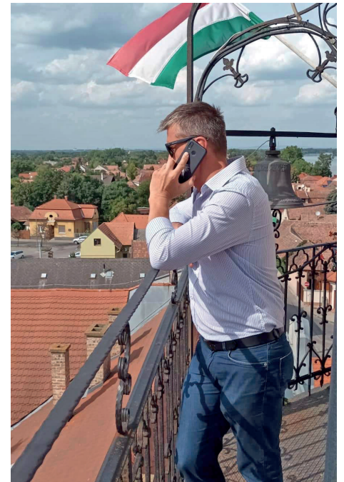
Munka közben a Tűztoronyban

-A szabadidőmet a családom körében szeretem eltölteni: sokat sétálunk, kerékpározunk, jó időben pedig a napi csobbanás a Dunában szinte kötelező. De a futás, barkácsolás, olvasás is kikapcsol.