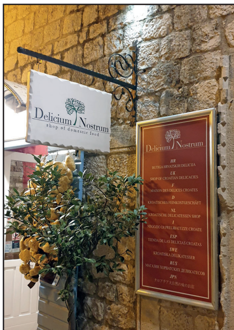
Cégér horvátországi kisvárosban

megjelenő reklámfelületek újragondolásával jelentős esztétikai és így minőségbeli változást tudunk elérni. Ráckeve épített és természeti környezetét megilleti az az igényesség, hogy annak értékeit állítsuk előtérbe és ne a sokszor silány minőségű grafikai és anyaghasználatú reklámok legyenek dominánsak. Természetesen igyekszünk különbséget tenni a reklámok, a közcélú hirdetések és a szolgáltatásokat megjelenítő cégek között. Ráckeve Város Képviselő-testülete által elfogadott szabályozásnak alapján minden szolgáltatás továbbra is jogosult lesz a szolgáltatás helyén cégérét megjeleníteni. Célunk,