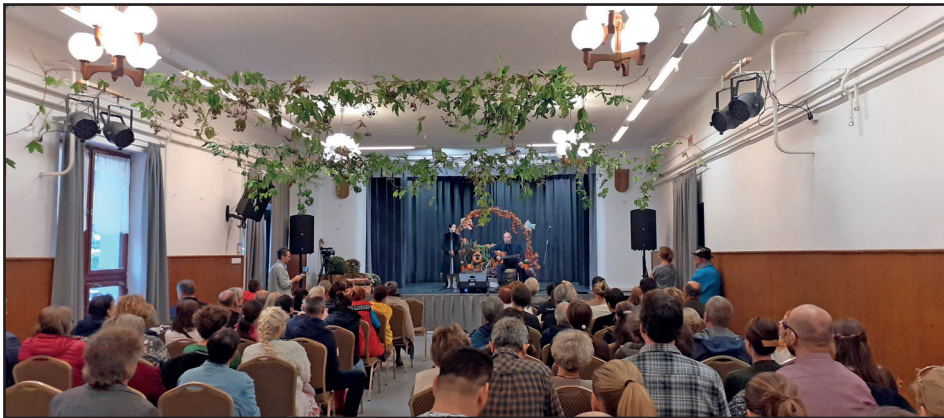
Romanimo lemez bemutatója

A gálaműsorban közreműködtek: Rózse Néptáncgyűttes - Ráckeve, Cavinton Vadrózsák – Budapest, Vasas Opsitosok, Sziget Néptánc-