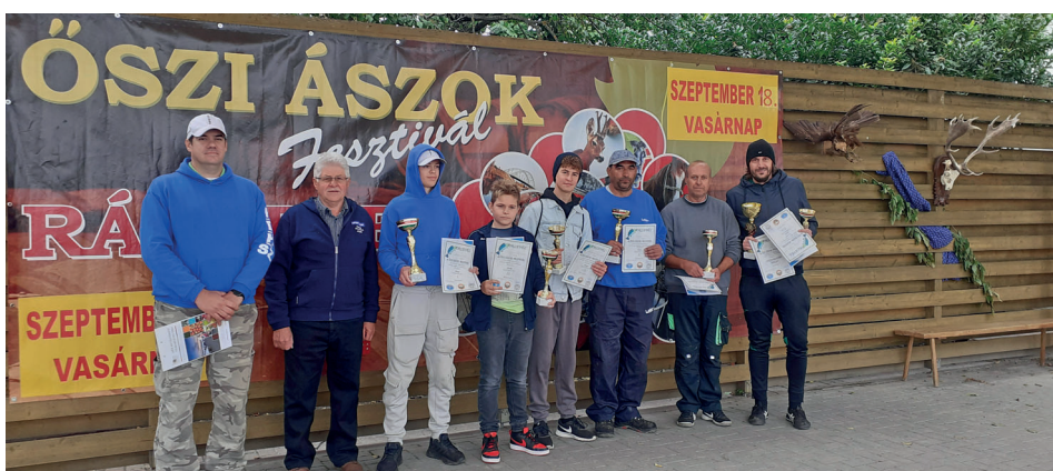
A horgászverseny nyertesei