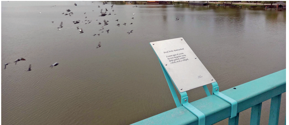
József Attila: Reménytelenül című verse

Hosszú várakozás után, kisebb ünnepség keretében hivatalosan is megnyílt a Versek hídja szeptember 18-án. Mint sokan emlékezhetnek rá, az ehhez köthető játékot még 2020 elején hirdette meg az önkormányzat, amikor arra kérte az irodalombarátokat, hogy osszák meg velünk a számukra legkedvesebb, legszebb vagy éppen legnagyobb jelentőséggel bíró versrészleteket, legfeljebb hármat, amelyekből majd négytagú zsűri választ ki 30-at, s azok fémlapra gravírozva az Árpád híd korlátjára kerülnek. A nemes versengés le is zajlott, s az irodalomtanárokból, könyvtárosból álló zsűri, akikhez a részletek név nélkül kerültek, meghozta döntését. Az ezt követő kivitelezést azonban elsodorták a Covid okozta pénzügyi nehézségek, s idén is csupán azért kerülhetett sor erre, mert még a jelenlegi válsághelyzet előtt indítottuk el