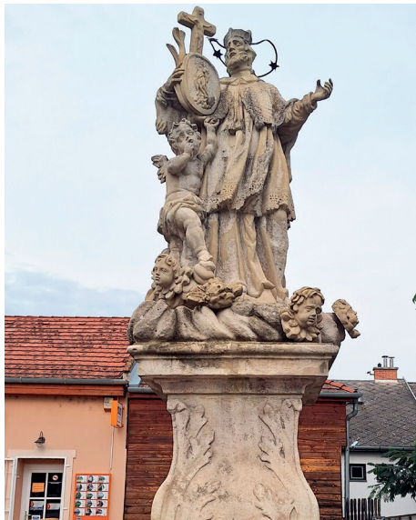
Nepomuki Szent János szobra