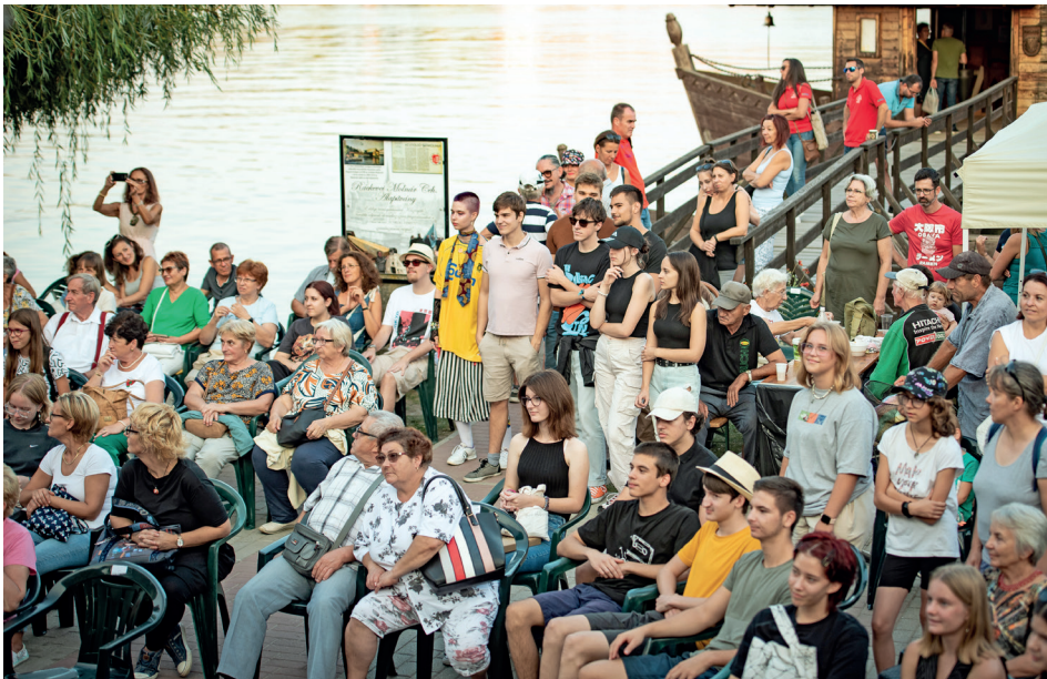
Szép számú érdeklődő gyűlt össze a sétányon