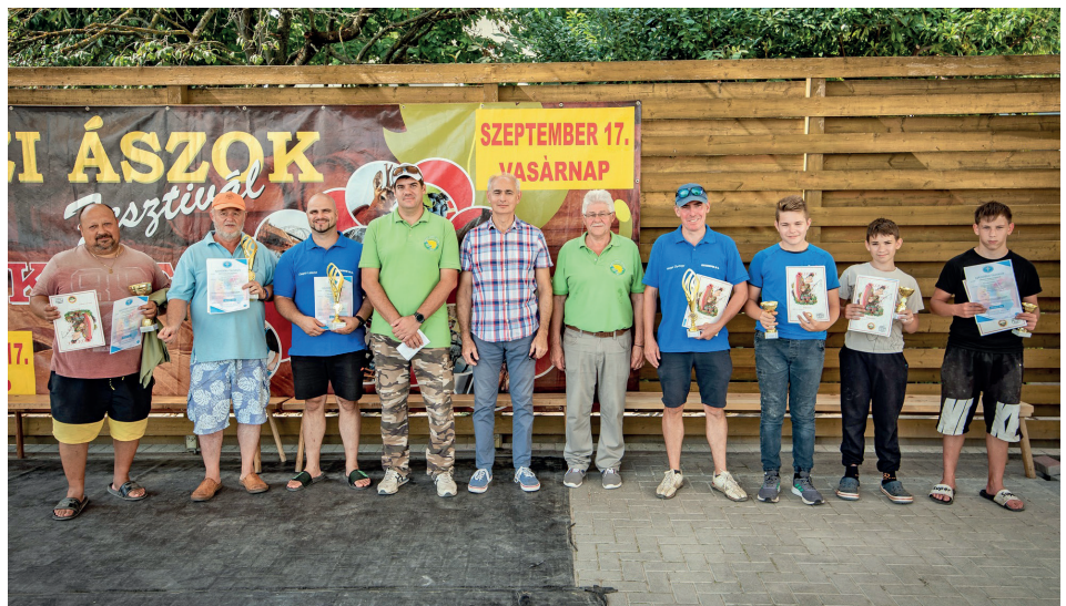
A horgászverseny díjazottai