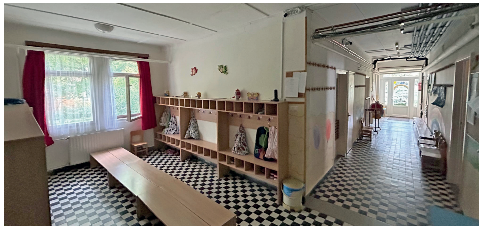
A megújultak az öltözőrészek

épület és a bölcsőde belső terei újultak meg. A kezdeményezés keretében, a megfelelő biztonsági szabályok betartásával, szabadságvesztési büntetésüket töltő, szaktudással, szakképesítéssel rendelkező fogvatartottak dolgoztak. A reintegrációs program, amely nemcsak a város lakóinak környezetét tette szebbé, hanem a fogvatartottak társadalomba történő beilleszkedését és