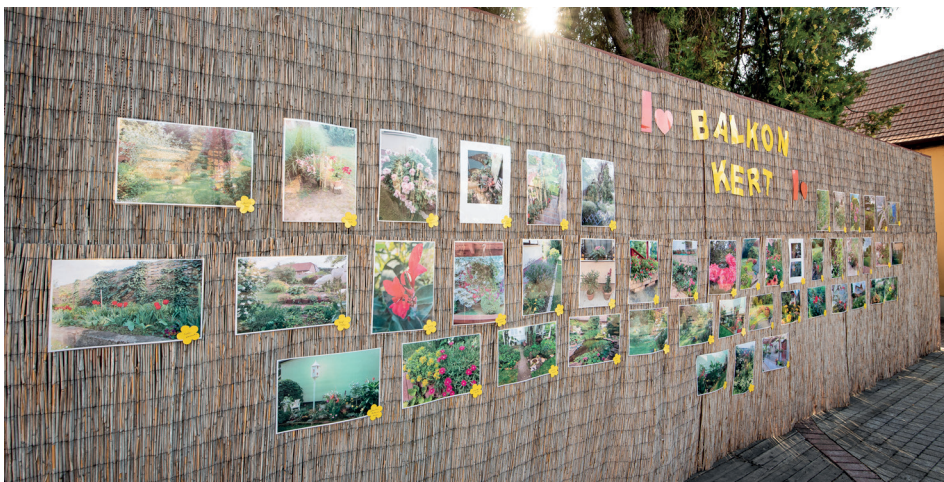
A legszebb kertekről, balkonokról készült fotók