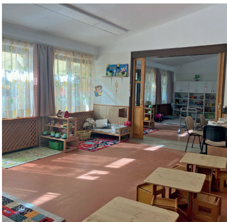
Megszépültek a csoportszobák

Helyenként 15 éves elmaradást is pótolva, mintegy 12 000 m 2 falfelületet festett újra térítésmentesen a Tököli Országos Büntetés-végrehajtási Intézet több fogvatartottja a nyár során Ráckeve Város intézményeiben. A munkálatokra az önkormányzat és a Tököli Országos Büntetés-végrehajtási Intézet közötti szerződés alapján került sor, amelynek köszönhetően idén négy óvoda-