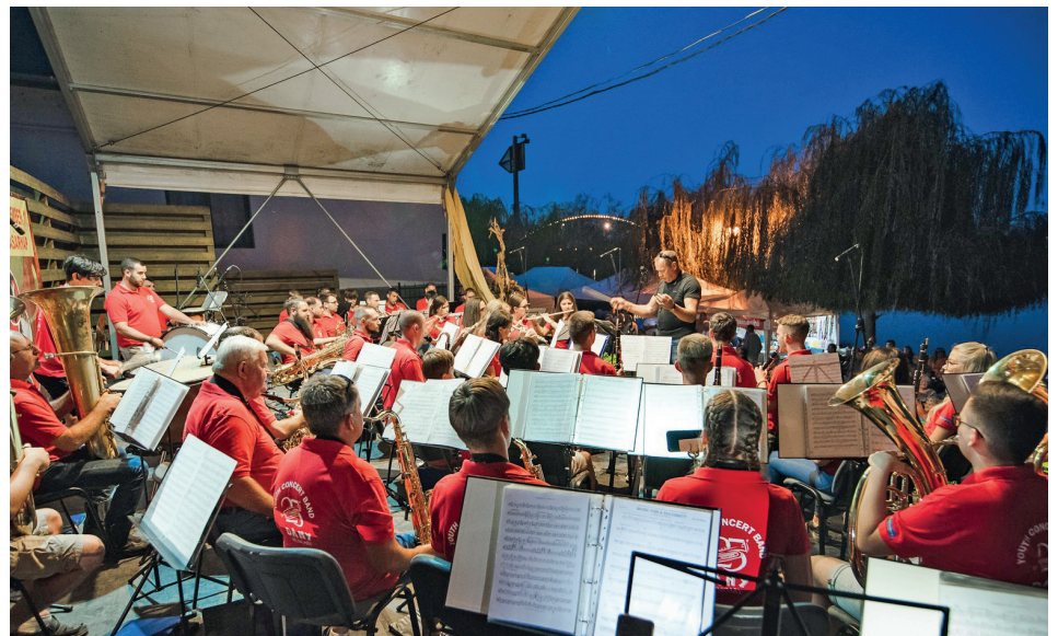
Színpadon a Dányi Fúvószenekar