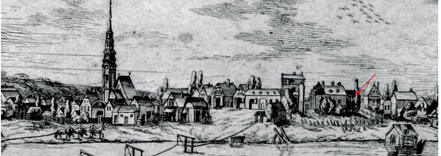
Részlet a Ráckevéről készült 18. század végi metszetből, a nyíl vélhetően a keresztet mutatja

Valamikor a régmúltban, talán a 18. század első felében a Ráckeve és Pereg között működő révnek (a mai Duna-híd helyén) a városi oldalon fekvő terén keresztet állíttatott fel – valószínűleg – a ráckevei magisztrátus. Az időjárás viszontagságai révén megrongálódott és leromlott keresztet 1789-ben, Deszpot József bírósága idején megújították.