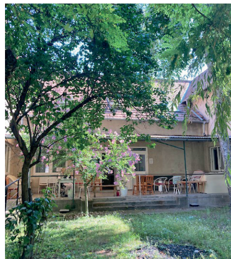
Az idősothton terasza

Az intézmény átvétele számomra is munka és időigényes, de megéri. Pozitív fogadtatást kaptunk a dolgozók részéről és a lakók is szívesen veszik és várják a változásokat. Nagy hangsúlyt fektetünk a napi szabadidős programok szervezésére, az időseink általános és egészségügyi állapotának feltérképezésére, valamint a hiányzó gondo-