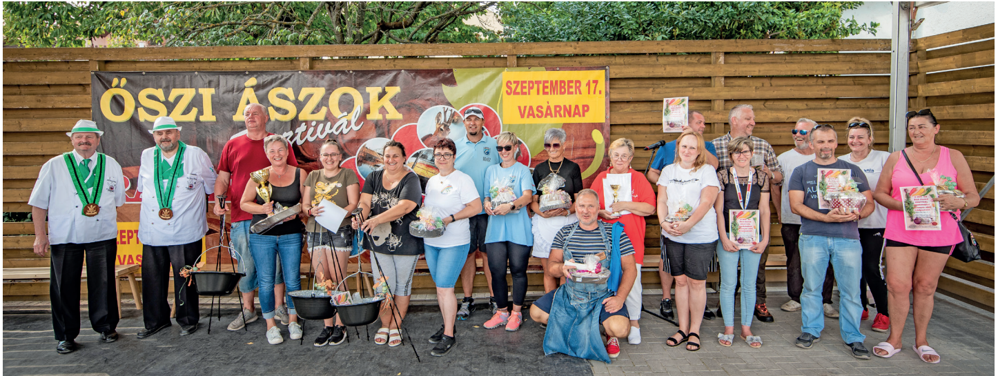
A főzőverseny díjazottai

Az őszi különleges hangulata mindannyiunkat elvarázsol. A mostani időszakban igazán szükségünk van együttlétre, ünnepre, melegségre, szeretetre.