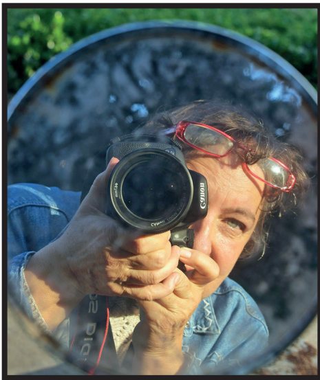
A fotózás szerelmese

„Akkor lennék boldog, ha mindent megmutattam...” /Bródy János