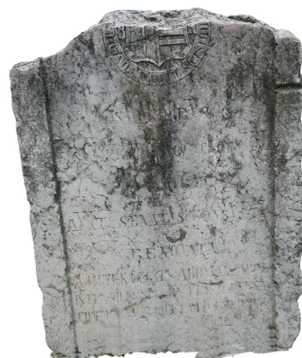
Az Árpád Múzeum udvarán álló talapzat

/ISTEN DICSŐSÉGÉRE FELÁLLÍTTA/TOTT ÉS MEGÚJÍTTATOTT 1897.” Ha már most visszaidézzük, hogy a hídtéri kereszt talapzatán mi állt (a város címere alatt a „SVM-tlbVs ftsCI prIVILeglatI oppIDI Vigore aVItI senatVs ConsVltI renoVata” szöveg), akkor meglepve olvashatjuk, hogy a kettő köszönő viszonyban sincsen egymással. Hogy a helyzetet tovább bonyolítsuk, még egy