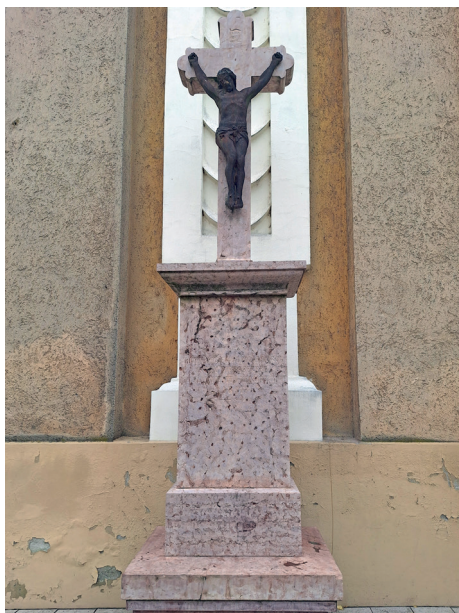
A templom előtt álló kereszt

nak is helyet csinálva), hanem az ott álló város-keresztet is el kellett bontani. Itt jött „kapóra”, hogy a templomnál volt keresztet pár évvel korábban ledöntötte a vihar, a város ugyanis a főbíró javaslatára a katolikus egyházközségnek adta a keresztet. Minderől Knezits Pál esperes-plébános – a Székesfehérvári Püspöki Levéltárban őrzött – a megyéspüspökhöz szóló 1897. november 24-i levelében így írt: „Ráczkeve mezőváros mint tulajdonos a kis dunai régi fahíd előtt állott márvány kőkeresztet a katolikus híveknek ajándékozta; ezen kereszt a hívek adományából befolyt összegben (160 frt) templomunk előtti téren felállíttatott és megújíttatott és így most már készen állva vár a felszentelésre. Ez okból a legmélyebb fűi tisztelettel kérem Méltóságodat, méltóztassék kegyesen megengedni, hogy ezen keresztet jövő vasárnap f. hó 28-án Isten dicsőségére megáldhassam.” A püspök november 26-i válaszában megadta az engedélyt, így Knezits Pál plébános november 28-án a 10 órai nagymise előtt a keresztet újból felszentelte és megáldotta.