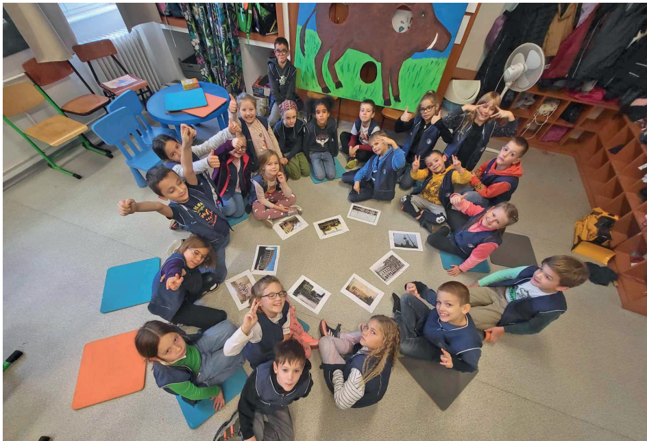
Vaddisznóra vadászva a játszóházban