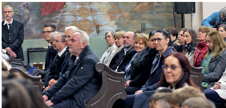
A jubileumi ünnepség vendégei

szerveznek iskolánk közösségének. Ez az öszszefogás, egymás iránti szeretet és támogatás azt gondolom a legerősebb iskolánk mindennapjaiban. A nagyobb gyerekek segítik a kisebbeket, idén elindult a mentorosztály programunk. Kimagaslóak a felzárkóztató és tehetséggondozó foglalkozások eredményei is. 19 sajátos nevelési igényű gyermek jár hozzánk, akiket nagy részben a saját kollégáink látnak el fejlesztő foglalkozások keretében. De a tehetséggondozás is kiemelt szerepet kapott, ennek eredménye a tavalyi 6 országos döntőn való részvétel, amelyből két esetben 1. helyezést értek el növendékeink.