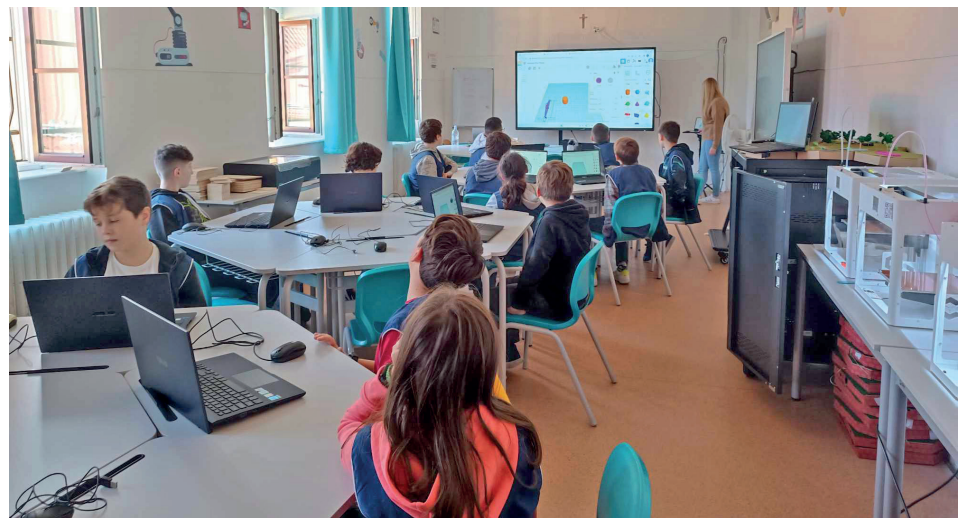
3D-s tervezés a high-tech teremben

Az alsó tagozatos diákok iskolánkról néztek meg videókat, majd régi képeinkből készült memóriajátékot játszottak és puzzle-t raktak ki. Kiszínezték a balatonalmádi Szent